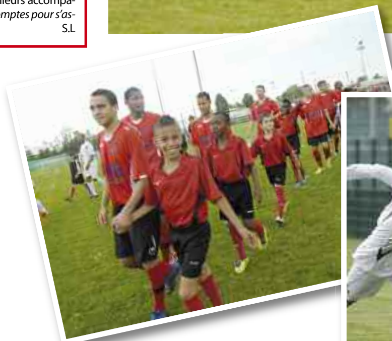
Pour le dernier match de la saison, le samedi 2 juin au stade Francisque-Jomard, les Vaudais enfin libérés, sont entrés sur le terrain avec les jeunes du club avant de s'imposer facilement (3-0) face à Marcy-Charbonnières.