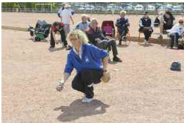
Après le tournoi qui a réuni 120 équipes à Vaulx et une centaine de féminines pour le tête-à-tête, l'ASPVV prépare le grand national d'automne.