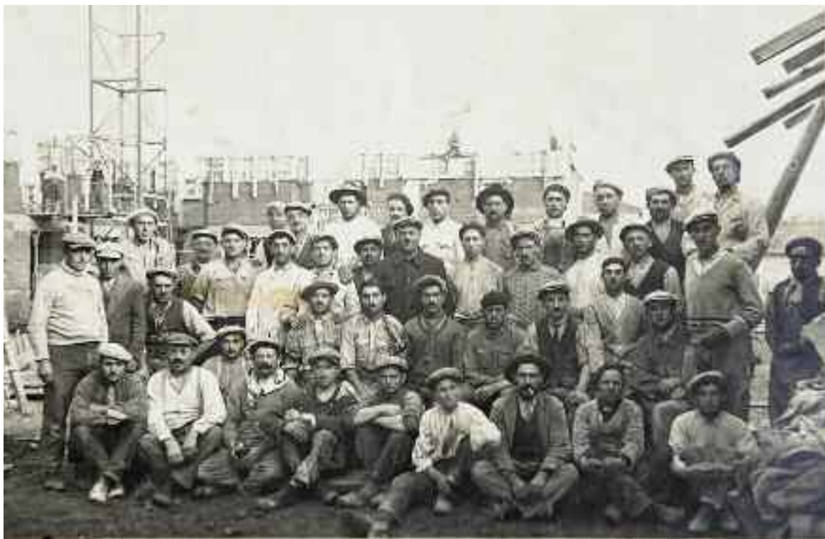
Les maçons de l'école du Pont des Planches au démarrage de sa construction.

Puis, il y aura la fête de l'école, le 16 juin. Celle-ci se déroulera de 11h à 16h, grâce à la mobilisation d'un petit nom-