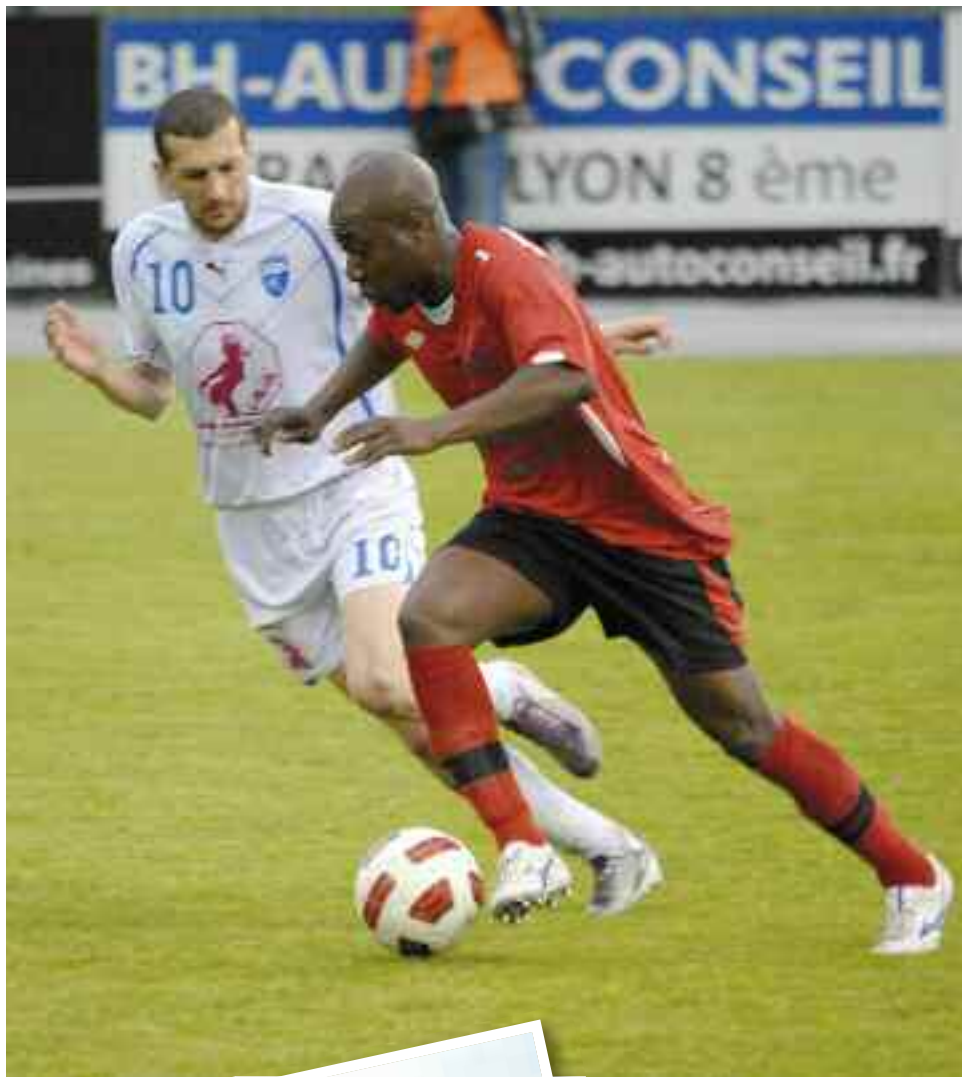
N'obtenant qu'un match nul à domicile (1-1) face à Limonest le samedi 19 mai, tout restait à faire...